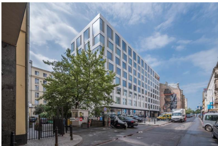
Zastosowanie szkła o niskiej zawartości żelaza Guardian UltraClear™ dodało realizacji lekkości i przejerności. Zdjęcia.