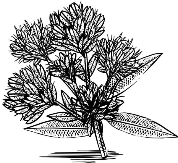
B-Circadin é extraído da planta Lespedeza Capitata, cultivada na Coreia do Sul, onde é utilizada por suas propriedades medicinais.