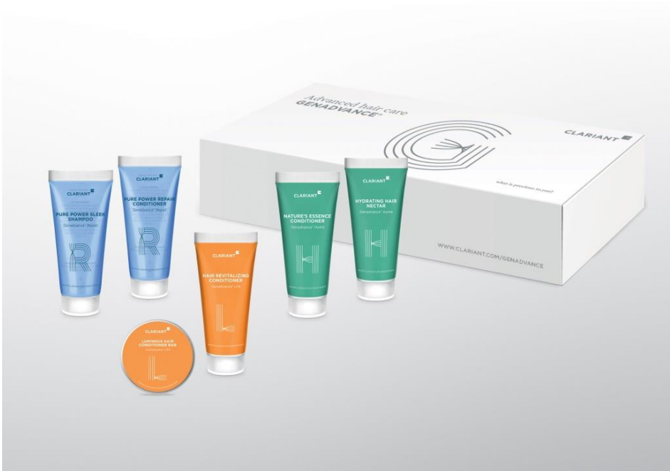
Clariant surpreende o mercado com os novos ingredientes de condicionamento capilar Genadvance.